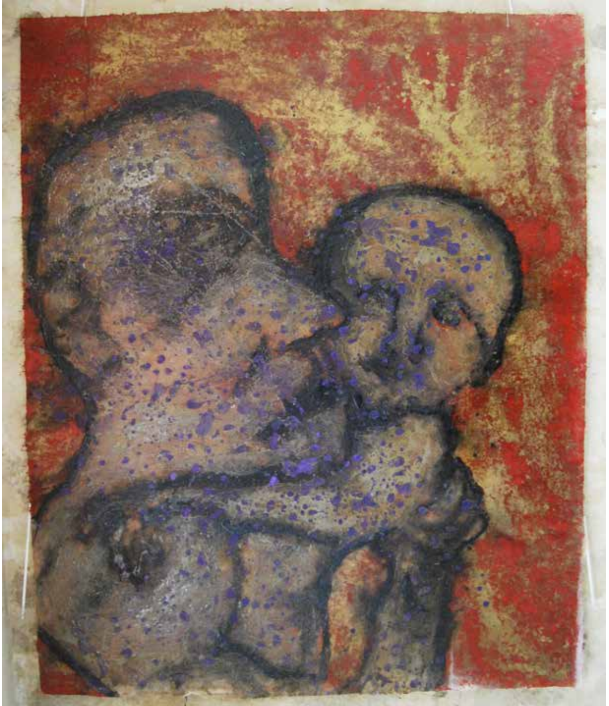
Autoportrait , 2015, résine sur fibre de verre, 120 x 140 cm