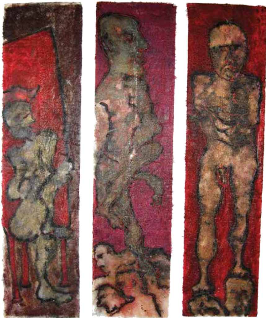
Sans titre , 2014, résine sur fibre de verre, 62 x 240 cm, 3 pièces