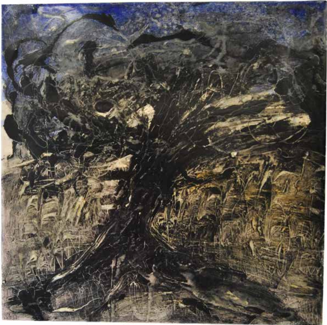
Sans titre , 2009, résine sur bois, 61 x 61 cm