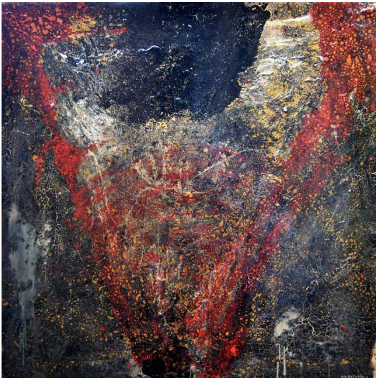
Sans titre , 2010, résine sur bois, 122 x 122 cm