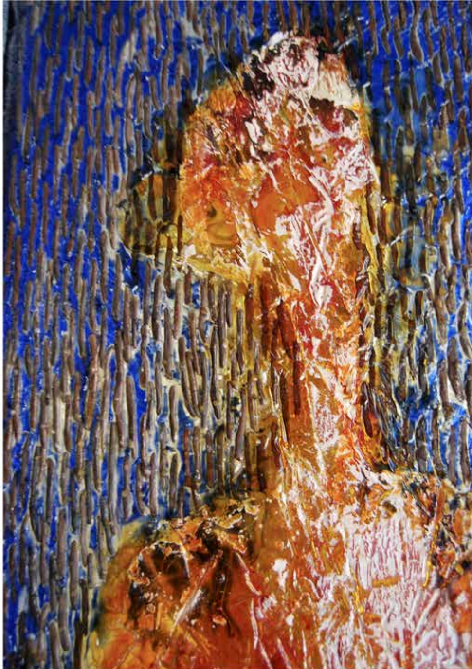
Xavier BOCCIO, Les gens, 2018, béton, métal, résine, 47 x 210 cm, détail

de la résistance au monde... à la confrontation à soi