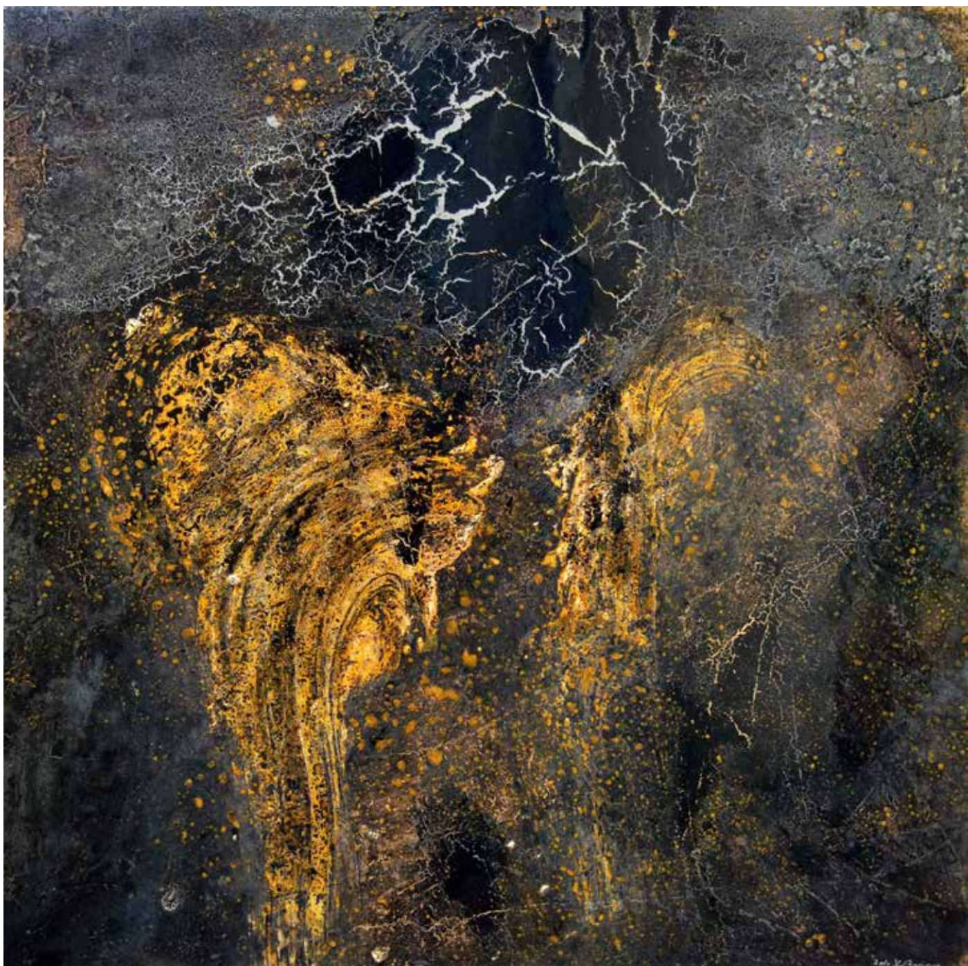
Sans titre , 2010, résine sur bois, 122 x 122 cm